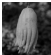
仏手柑(ぶっしゅかん) 50g : 1735円

仏の手の形をした蜜柑の仲間。薄暗いところで見ると、誰かの手みたいで一瞬ドキッとします。とても貴重な植物で、爽やかな香り成分がストレスをやわらげ気持ちを楽にしてくれます。漢方薬ではあまり使うことがありませんが、薬膳では主に鬱などの症状を改善する薬膳茶として使われます。胃腸の動きもスムーズにしてくれるため、食後のお茶にもおすすめ。気持ちの落ち込みやイライラ等からくる、食欲不振、胃もたれ、胃痙攣などの痛みにも他の生薬やお茶などと一緒にブレンドすると良いですよ。