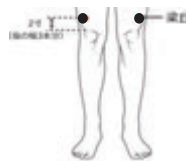
梁丘(りょうきゅう)

膝のおさら上部の外側から指3本上にあるツボです。骨のすぐ外側にあります。胃痙攣など胃の痛みや下痢におすすめです。