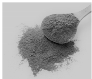
各 30g & レシピ付き 【1,296 円】

もっと手軽に薬膳生活を楽しみたい方へ。はとむぎ、山査子、なつめのパウダーがセットになりました。抽出する手間がなく、生薬をそのまま取ることが出来ます。手作りスムージーに入れたり、お菓子作りやお料理に加えたりお役立ててください♪