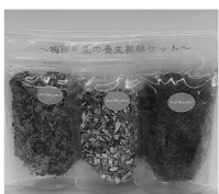
蓮の葉 10g・陳皮 30g とうもろこしのひげ 5g

日本の夏は蒸し暑い！体に溜まった余分な水を排出し、こもった熱を冷ます動きのあるこれからの季節に活躍するセットです。蓮の葉、とうもろこしのひげ、陳皮の3種類で、全て混ぜてお茶にしてよし、単品で料理に使ってもよし。ちょっとずつ試してみたい方や、とりあえず体に良いものを何か試したい！という方におすすめです(^^)