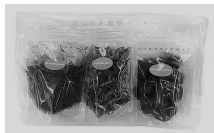
よもぎ・紅花・なつめ 864円(税込)

身体の内側を温める「散寒」の働きがあるよもぎ、瘀血を改善する紅花、気血を補うなつめの3種の組み合わせ。すべて混ぜて冬の養生薬膳茶に、別々にお料理や自分好みの薬膳茶に混ぜてもおいしいですよ(*^^*)2月までの限定です！