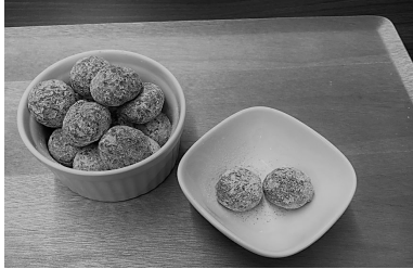
【紅花スノーボール 約28個分】

いよいよ寒さが本格的になり、平成最後の年末年始は大寒波と予想されています。寒さのサポートに、血を温めながらめぐらせる紅花がおすすめ！ 紅花は古来から栽培され、染物や口紅などに使用されました。また漢方では婦人薬として必要な生薬で、月経不順、冷え症、更年期障害、血行障害などの改善に用いられてきました。スノーボールクッキーは材料を混ぜて丸めて焼くだけなので、お子様と一緒に作ってみられてはいかがでしょうか？