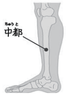
「中都」 内くるぶしと膝関節を結ぶ線の 中点より少し下。 肝臓の働きをスムーズにし、血流を良くするツボです。