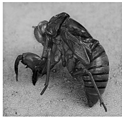
大型セミの抜け殻

梅雨が明けると一気にセミの鳴き声が響き渡り、「夏だな～」と実感します。そのセミの抜け殻、実は薬になるってご存知でしたか？ 蝉退はアトピー性皮膚炎や発疹など皮膚病の炎症やかゆみを改善する働きに優れています。漢方では「消風散」という皮膚病の処方に入っています。五臓の「肺」「肝」の熱を冷まし肺に関係する呼吸器系（風邪症状など）や皮膚病、肝に関係する目の充血や筋肉のひきつりにも使います。夏場は蝉退が取り放題ですね！ただし日本では医薬品になります(^^)