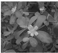
五行草 (馬齒莧) 100g : 1620 円

五行草という名前は聞きなれないですが、実は日本でたくさん自生している「スベリヒユ」という草です。またの名を馬齒莧 (ばしけん) といいます。「五行」という名前は、東洋医学でいう「五行」の色から来ています。葉の緑 (青) は肝、茎の赤は心、華の黄は脾、根の白は肺、種の黒は腎。このように体のすべてに効く、と考えられています。効能は清熱解毒。炎症や熱症状をとり、毒素を排出します。お茶として飲むことも、入浴剤など外用としても効果を発揮します。皮膚症状におすすめです。