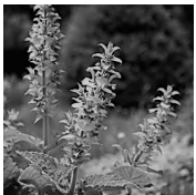
ドイツオーガニックブランド PRIMAVERA