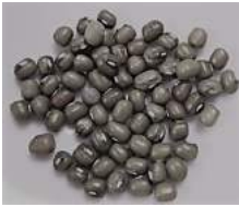
緑豆 200g : 2268円

日本では緑豆もやしや春雨などはよく見かけますが、緑豆そのものはめずらしいのでは。中国では、夏にお茶やお料理に活躍するお豆です。身体を熱をおしと一緒にはっきり出してくれますし、のどの渇きにもよいので、夏バテの予防にオススメです。小豆の半分ほどの大きさで、ウグイス色のかわいいお豆ですよ!