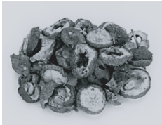
山査子 100g: 648円

砂糖と寒天を加えてスティックしたお菓子としても有名な、酸味のある果実です。漢方では血をサラサラにして巡らせる「活血」という働きがあります。消化剤として、特に肉類の消化を助けてくれるので、ダイエットにもおすすめ。未病ラボフェスで販売する、美肌スムージーにも入ってますよ♪