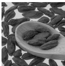
クコの実 100g: 1134 円

杏仁豆腐の上にちょこんと飾られた、赤い実の「クコ」。実は古くから中国では「腎」や「肝」を補うアンチエイジングの妙薬であり、「ゴジベリー」として海外のセレブも取り入れているスーパーフードです。目にも良いので眼精疲労にもおすすめです。